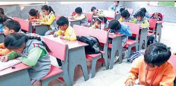
राई। पत्र लेखन में भाग लेते हुए जी डी गोयनका स्कूल के छात्र।