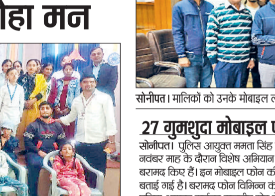
गोहाना। समारोह में विजेता विद्यार्थियों को सम्मानित करते हुए अतिथि एवं शिक्षकगण।