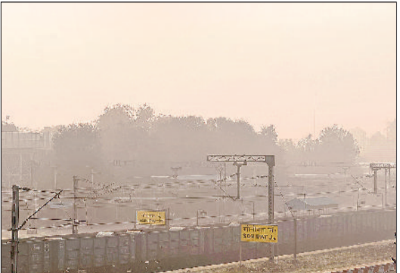
सोनीपत। सुबह के समय छाई धुंध।

उत्तर दिशा से आ रही बर्फीली हवाओं और पश्चिमी विक्षोभ के गुजर जाने के बाद अब उत्तर भारत में मौसम का मिजाज तेजी से बदल रहा है। अधिकतम और न्यूनतम दोनों ही तापमान में अचानक आई कमी ने ठंड की धार को और तेज कर दिया है, जिससे जनजीवन प्रभावित होने लगा है। इस कड़ाके की ठंड के बीच वायु प्रदूषण का स्तर भी गंभीर बना हुआ है, जिसने स्वास्थ्य जोखिमों को बढ़ा दिया है। बुधवार को वायु गुणवत्ता सूचकांक (एक्यूआई) बेहद खराब श्रेणी में 308 दर्ज किया गया, जो ठंड के साथ-साथ एक दोहरी चुनौती पेश कर रहा है।