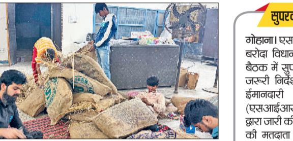
सोनीपत। जूट के गद्दे तैयार करते फाउंडेशन के पदाधिकारी।