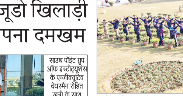
सोनीपत। ग्रीन प्रमोशन ड्राइव के दौरान हिंदू गर्ल्स कॉलेज की पनसीसी कैडेट्स।