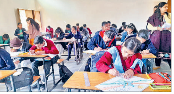
सोनीपत। प्रतियोगिता के दौरान हिस्सा लेते प्रतिभागी विद्यार्थी।