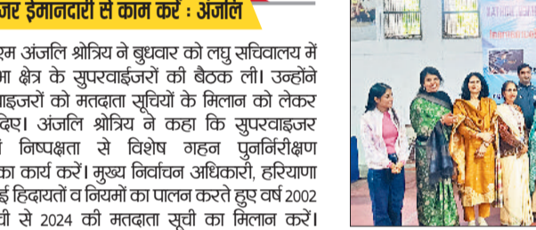
सोनीपत। विजेता छात्राओं को रोहताक में सम्मानित करते हुए।